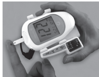
血糖測定器と接続するだけの簡単操作で測定データと患者情報の管理を自動化し、データの取り違え防止に貢献

●問い合わせ先 アークレイマーケティング株式会社 (TEL: 050-5527-7700)